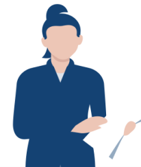
Bestuurder & Beleidsmaker

Actueel inzicht Vertrouwen in informatie Beter kunnen sturen